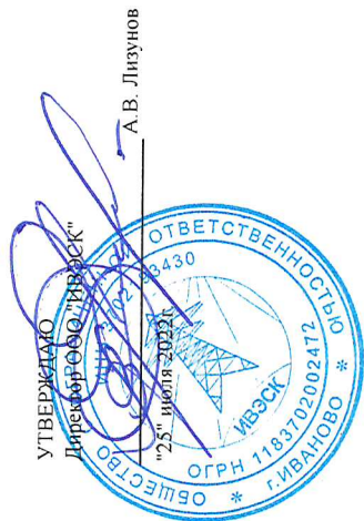
ГРАФИК ограничения режима потребления электрической мощности на 2022/2023гг. ООО "ИВЭСКС"